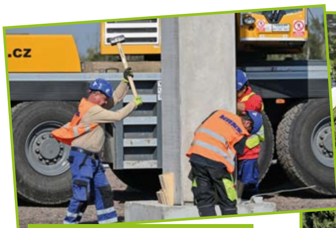
Stavaři zajišťují osazení prvního sloupu vznikající haly.