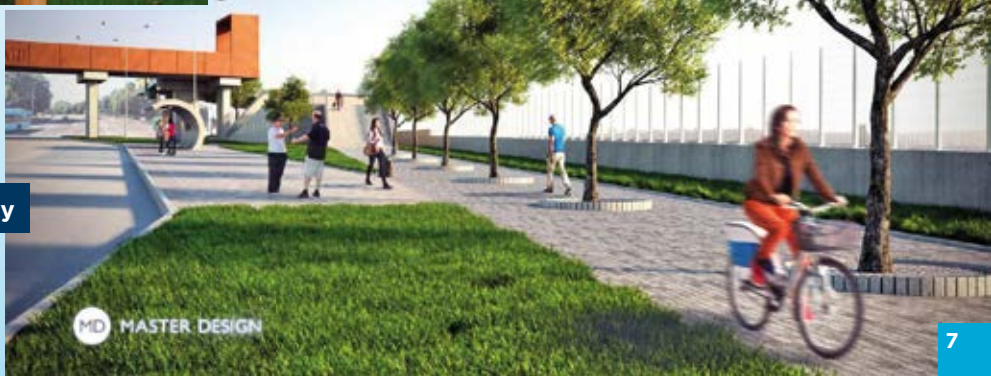
Veřejné prostranství Bazaly

Na konci loňského roku zahájil městský obvod úpravy zahrady MŠ Požární. Provedeny byly terénní úpravy a demolice původního zahradního domku. Školní zahrada byla rozšířena na sousední pozemek, který za tímto účelem městský obvod vykoupil. Vznikl zde prostor pro altán, doplněny byly nové hrací prvky, skákací panák s dětským basketbalovým košem i prvky sloužící ke zlepšení fyzických a motorických schopností dětí, jako je interaktivní tabule či sestava pro děti ve věku 3-6 let. Děti mohou využít také malý lanový park s překážkovou dráhou pro hasiče a dvě houpací hnízda. Vybudováno bylo sedm parkovacích stání a vysazena zeleň. Náklady na stavbu činily 4 miliony korun.