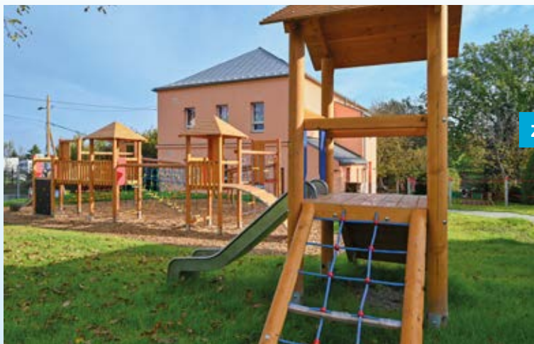
Zahrada MŠ Požární

Pro proměnu tváře obvodu bude neméně důležitá i proměna staré betonové lávky nad Bazaly. „Namísto pouhé opravy jsme se dohodli se zástupci vedení města a městskou společností Ostravské komunikace, která lávku spravuje, na celkové revitalizaci a humanizaci prostoru lávky. Ta je zároveň ideální vyhlídkou na město a pro řadu lidí i kultovním místem. Namísto pěti metrů široké betonové plochy, zde vznikne sympatický prostor osázený zelení a vyhlídka se dočká integrovaného rámu, díky němuž zde budou moci vznikat zajímavé fotografie s výhledem na město v pozadí,“ uvedl o plánovaných změnách nad legendárním stadionem starosta Richard Vereš.