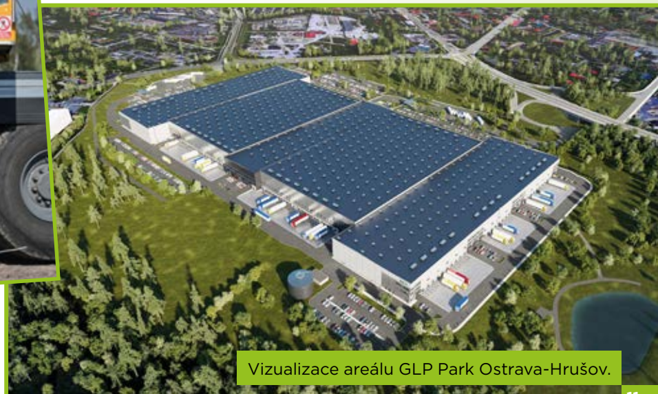
Vizualizace areálu GLP Park Ostrava-Hrušov.